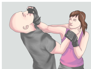
SELF - DEFENSE